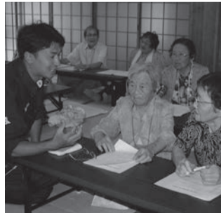
白須賀買い物弱者対策調査