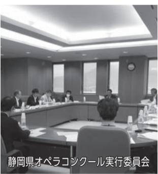
静岡県オペラコンクール実行委員会