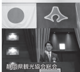
静岡県観光協会総会